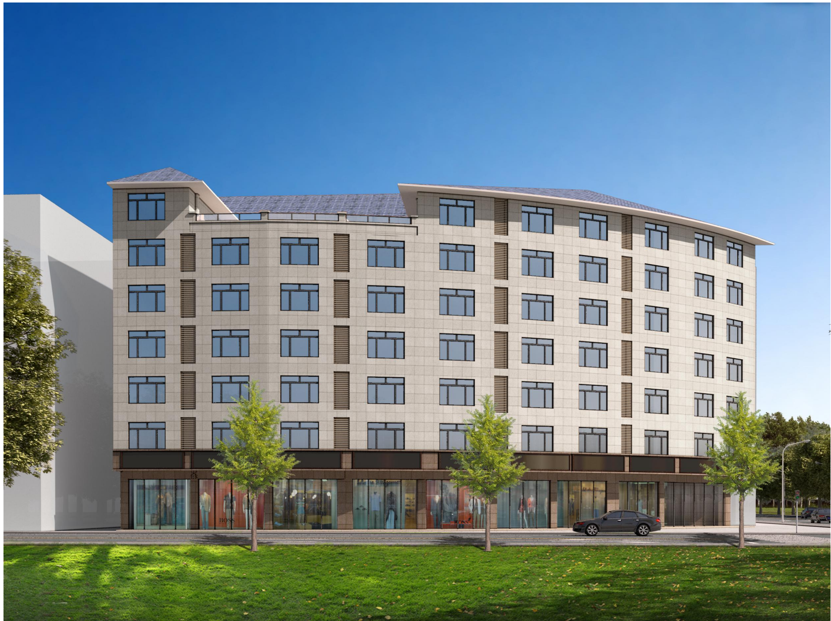
贺州市八步区八达西路南面一类地 81 号西边公建地（黄有志、归晓梅）户住宅楼效果图