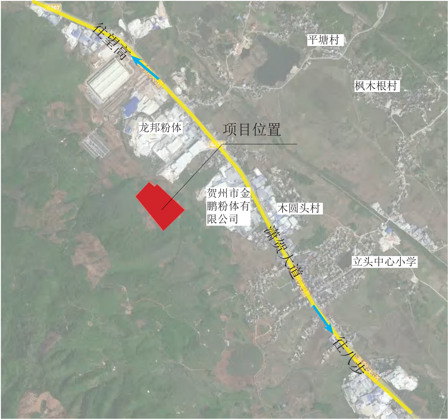
项目在平桂区的位置

项目位于贺州市平桂区，处于广西贺州市平桂区白岩街与同乐大道交汇处西南侧，隶属于望高镇，项目周边均为工业用地。周围市政设施正在建设，规划交通网络四通八达。本项目距离工业园区 10 公里，距离望高镇 6 公里，距离八步区 22 公里，地理位置优越，与周边企业形成集约化的碳酸钙工业区。